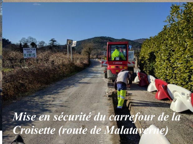
Mise en sécurité du carrefour de la Croisette (route de Malataverne)