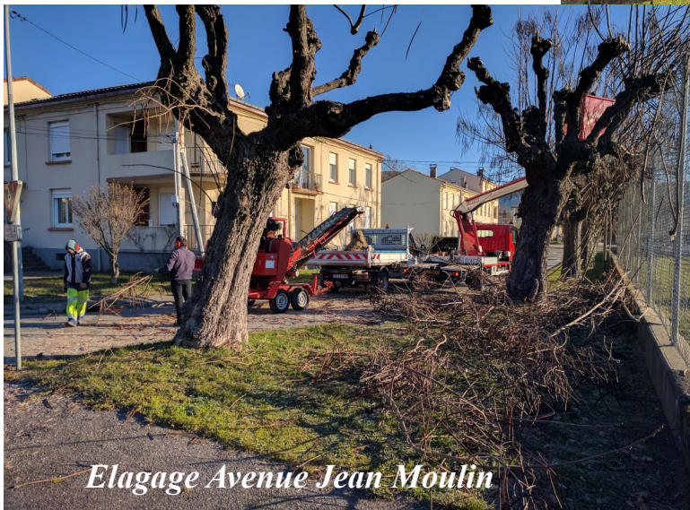
Elagage Avenue Jean Moulin