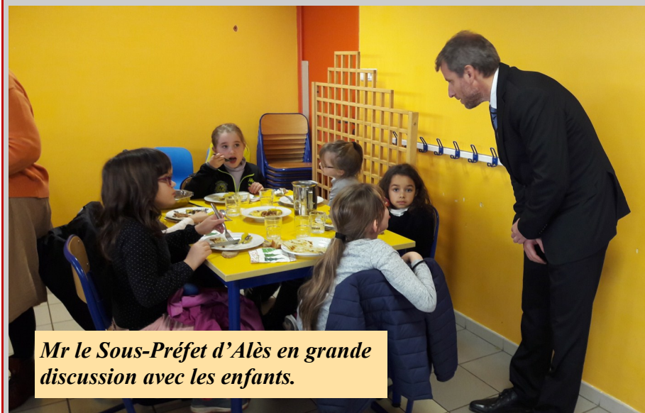
Mr le Sous-Préfet d'Alès en grande discussion avec les enfants.