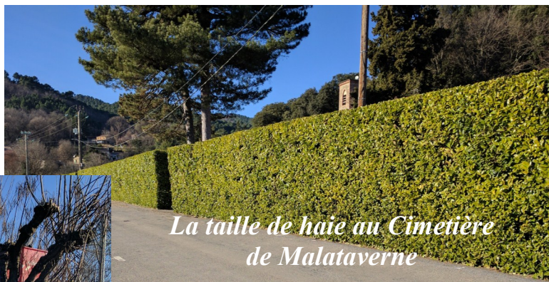
La taille de haie au Cimetière de Malataverne